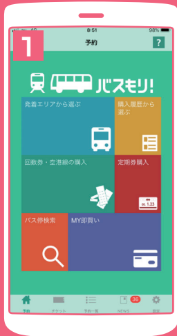
回数券・空港線の 購入をタップ