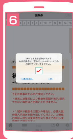
チェックを入れてから OKを選択