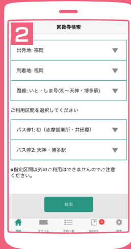
出発地(福岡)・到着地 (福岡)路線を選択 バス停1、バス停2を選択