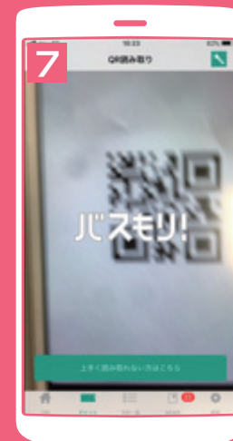
運賃箱に設置してある QRコードをスマホで 読み込む