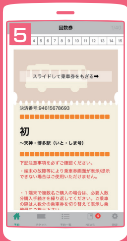
乗車券を「もぎる」 操作をお客様 自身で行う