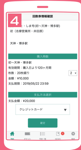
冊数を選択し、お支払い方法 を選択して購入完了 (クレジット・コンビニ・銀行ATM・ネットバンキング)