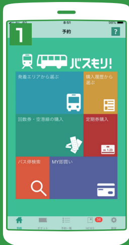
回数券・空港線の購入をタップ