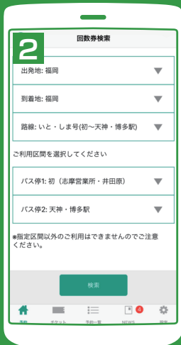
①からつ号、いまり号; 出発地(佐賀)、到着地(福岡)を選択 いと・しま号; 出発地(福岡)、到着地(福岡)を選択 ②路線、バス停1、バス停2を選択