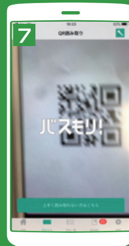
運賃箱に設置してある QRコードをスマホで 読み込む