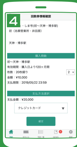
冊数を選択し、お支払い方法 を選択して購入完了 (クレジット・コンビニ・銀行ATM・ネットバンキング)