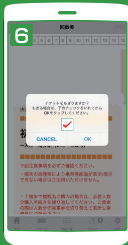
チェックを入れてから OKを選択