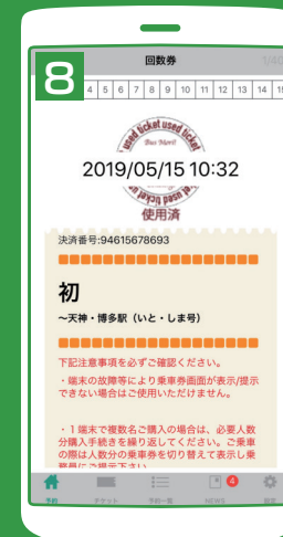
QRコード認証後に 表示される利用日・ 利用時間を運転士に提示